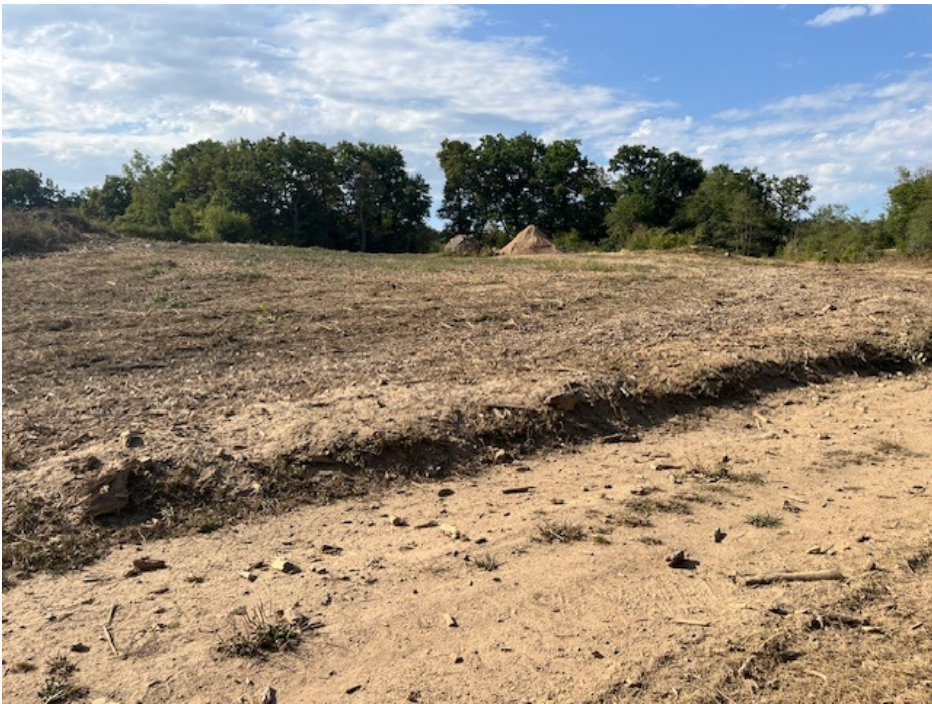
PDV 1 et PDV 2 - Localisation du projet dans son environnement proche