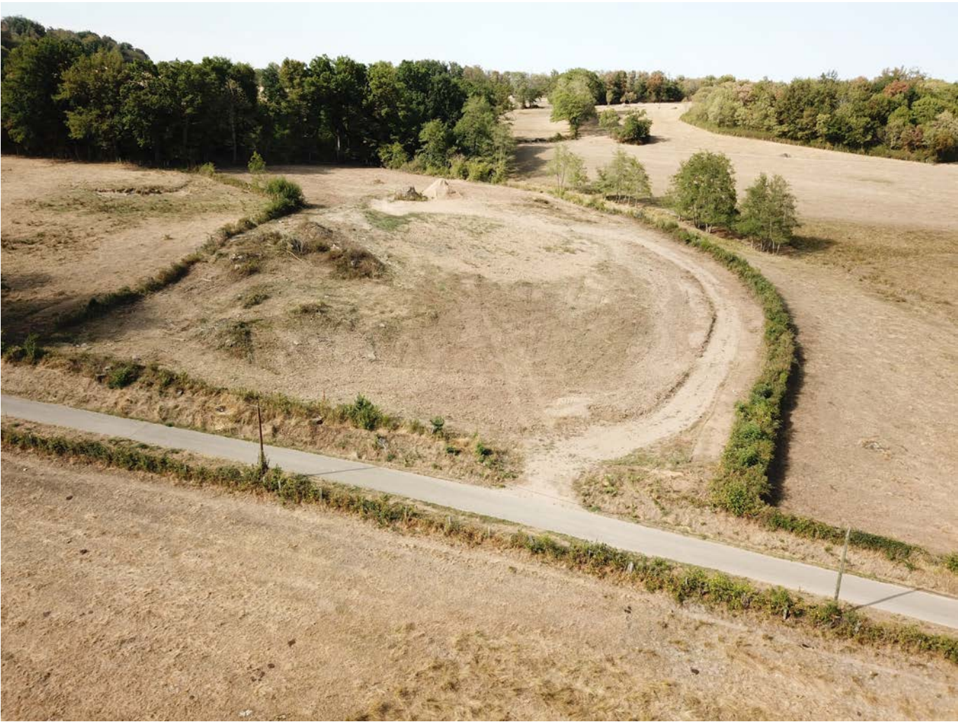
PDV 3 - Localisation du projet dans son environnement lointain (prise de vue par drone)